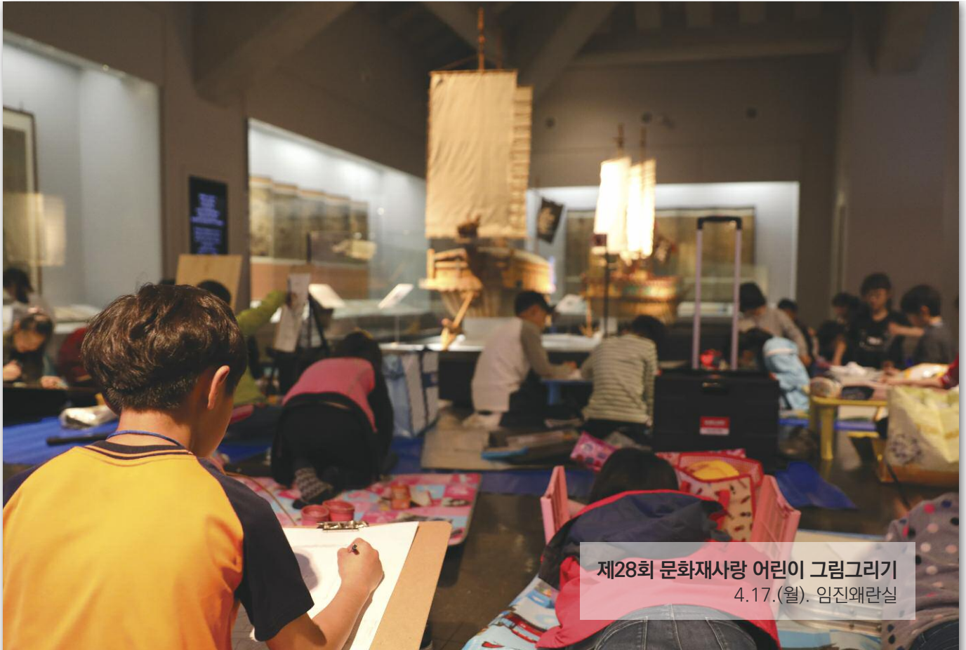
제28회 문화재사랑 어린이 그림그리기 4.17.(월). 임진왜란실