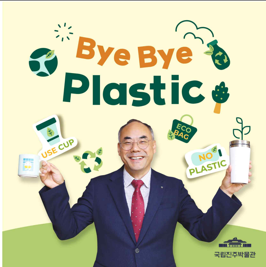
국립진주박물관장 ‘바이바이 플라스틱’ 챌린지 참여 모습