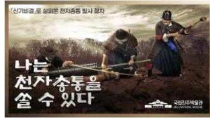
'나는 천자총통을 쏠 수 있다' - 『신기비결』로 살펴본 천자총통 발사 절차 썸네일