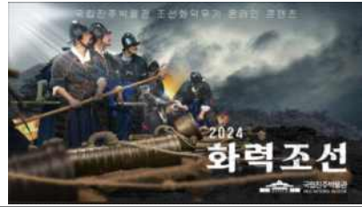
<화력조선> 시즌5 썸네일

‘[전 국민 필수 교양] 1분 만에 익히는 현자총통 발사 절차’ 쏘츠 이미지