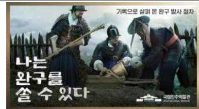
'나는 완구를 쏠 수 있다' - 기록으로 살펴본 천자총통 발사 절차 썸네일