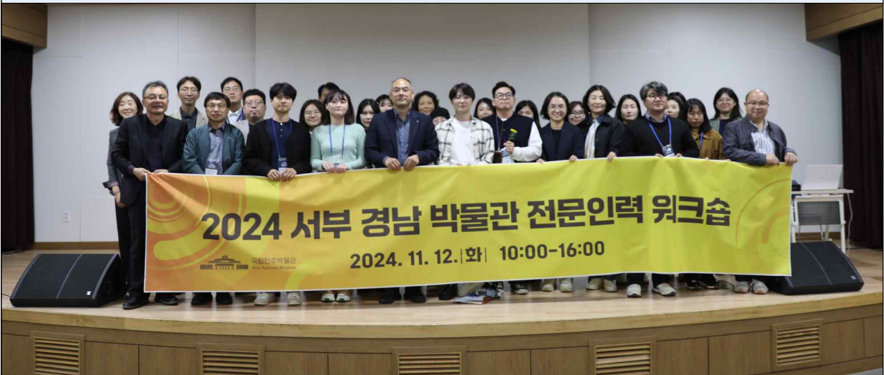
▲ 2024년도 서부 경남 박물관 전문인력 워크숍 참석자 단체 사진