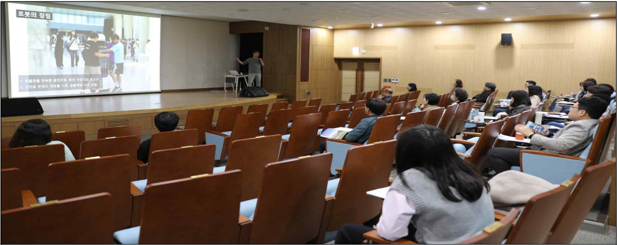
▲ 워크숍 진행 모습