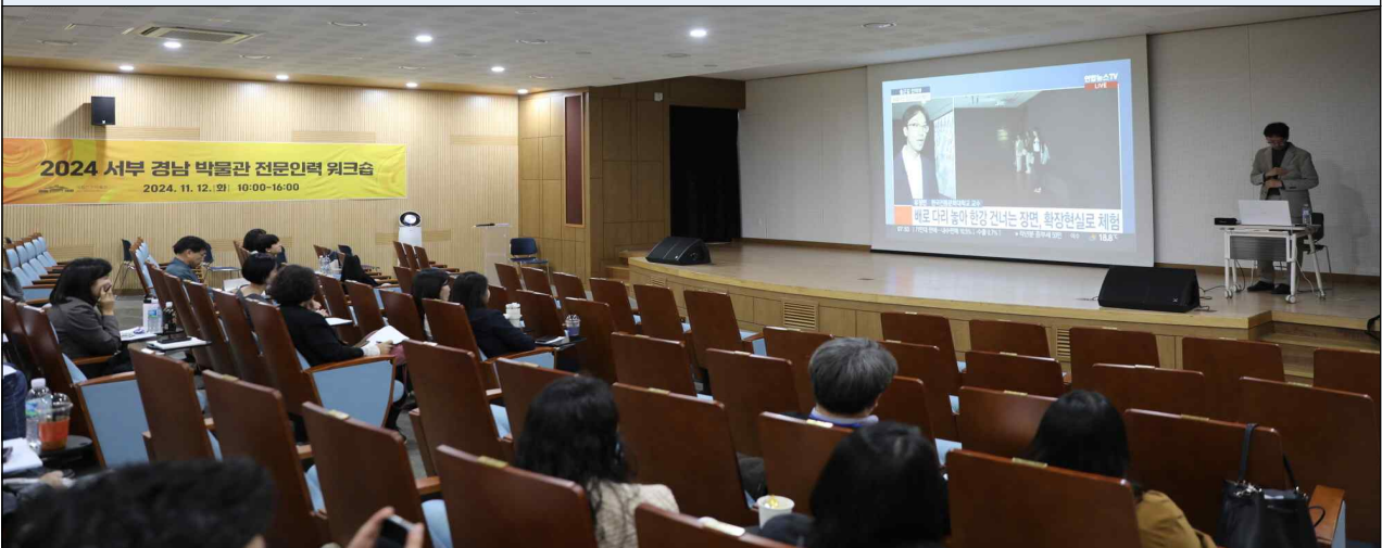
▲ 워크숍 진행 모습