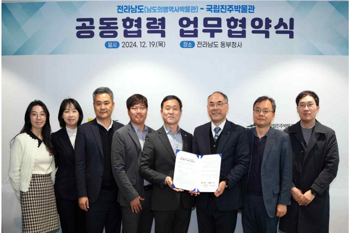
사진 2 국립진주박물관-전라남도(남도의병역사박물관) 업무협약.