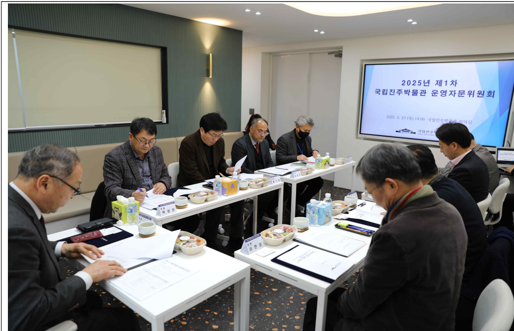
회의 진행 모습