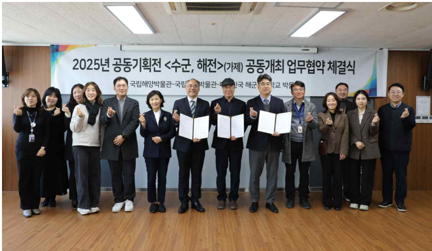
국립진주박물관, 국립해양박물관, 해군사관학교박물관 관계자들이 업무협약을 체결한 뒤 기념사진을 촬영했다.